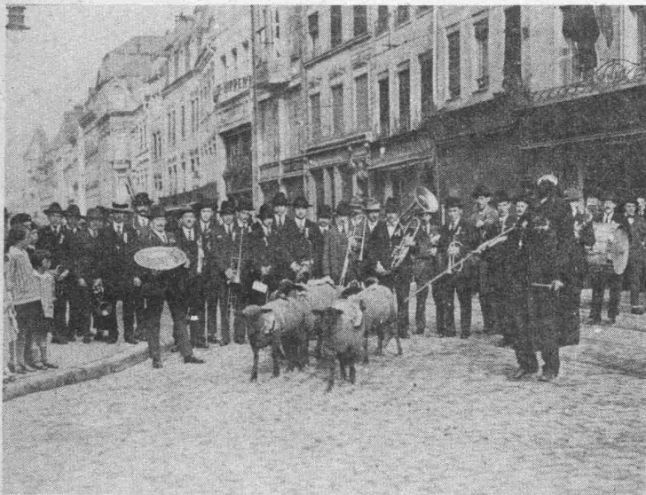
Une vieille coutume locale: Le défilé du „Hämmelsmarsch," le Dimanche de la „Schu'eberrössch."